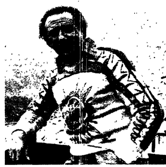
Mike Bongiorno riparte con il suo inossidabile quiz

È la qualità totale. Versione berlusconiana. E infatti il nostro grande patron Silvio Berlusconi doveva essere l'ospite d'onore della prima puntata di Telemike.