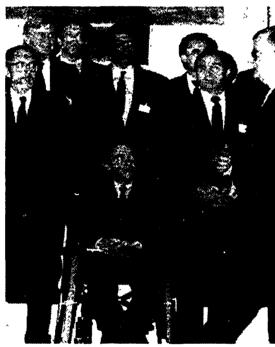
Foto di gruppo della conferenza ministeriale sull'immigrazione a Berlino