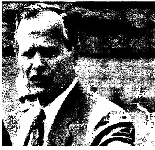
Il presidente Usa, George Bush