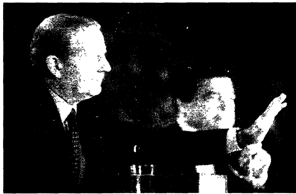
Il segretario di Stato Usa James Baker durante la fase finale della Conferenza per la pace in Medio Oriente

MADRID Mago Baker. Lui l'ha definita «persuasione e influenza dietro le quinte». Ma è apparso piuttosto come uno straordinario gioco di prestigio il modo come è riuscito a salvare per il rotto della cuffia, a rianimare in extremis, una conferenza per la pace in Medio Oriente che sembrava irrimediabilmente arenata. Sul ciglio dei minuti. Con un susseguirsi di colpi di scena, acrobazie mozzafiato. All'una, con il suo lapidario «è terminata», il siriano Faruk Al-Shara sembrava averle dato il colpo di grazia. Alle due, presentandosi alla conferenza congiunta con il collega sovietico Pankin, Baker aveva dovuto confessare che non c'era ancora accordo sui come e dove passare alla seconda fase, gli incontri faccia a faccia bilaterali. Alle quattro c'era già il consenso di Shamir a Gerusalemme e del siriano a Madrid. Si vedranno domenica a porte chiuse nella capitale spagnola, in incontri bilaterali «paralleli». E lì, per la prima volta, chi nella conferenza plenaria non si era neppure stretto la mano, non si era scambiato neppure uno sguardo, si ritroverà faccia a faccia. Tutto resta ancora appeso al filo del dove proseguire dopo domenica. A Madrid come vogliono gli arabi, Usa e Urss, in Medio Oriente, come vuole Shamir, o a Washington. Su questo ancora si stanno dilaniando gli arabi, si sono spaccati gli israeliani, con due dei loro delegati tornati a casa di testa propria. Ma Baker si dice fiducioso che lasciata alle spalle la fase in cui ciascuno doveva per forza esprimere le