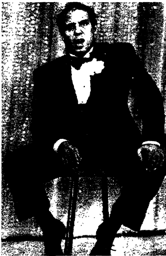
Adriano Celentano, stasera a «Notte Rock»