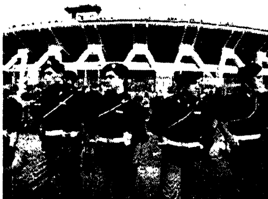
Immagini domenicali a destra, tifosi sulle gradinate di San Siro e, a sinistra, stadio in stato d'assedio con presenza massiccia di forze di polizia

Ogni domenica una partita a rischio in diretta, trasmessa nella città la cui squadra gioca in trasferta. Per tenere gli ultra accanto agli schermi televisivi e lontano dagli stadi. Una pensata firmata Silvio Berlusconi, che già circolava ed ieri è stata rilanciata. Berlusconi impiegherebbe Tele+ su questo versante social-spettacolare. Dietro corresponsione di un canone di abbonamento ad una possibile pay-tv.