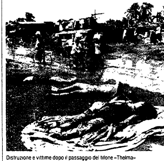
Distruzione e vittime dopo il passaggio del tifone «Thelma»