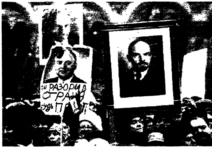
La manifestazione a Mosca dei comunisti nella Piazza Rossa per celebrare il 74° della Rivoluzione