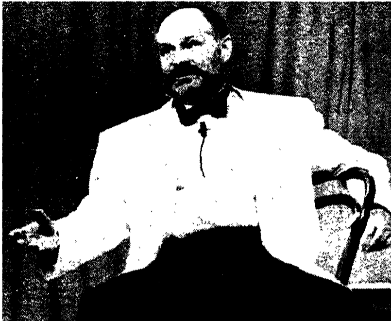
Ekkehard Schall in questi giorni a Bologna per un recital su Brecht