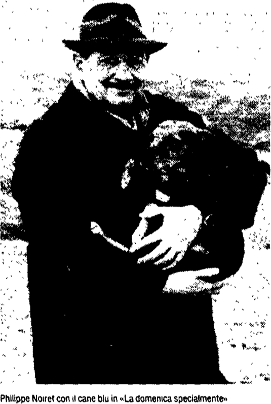
Philippe Noiret con il cane blu in «La domenica specialmente»