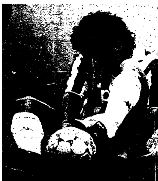
Roberto Baggio, l'osservato speciale del derby della Mole. Sopra, Roberto Mancini ha detto la sua sul caso Van Basten