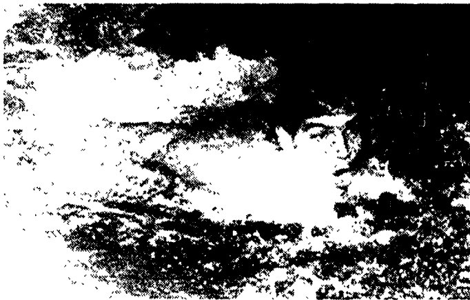
I due volti di Mark Spitz: a destra nella versione attuale. A sinistra Mark in una foto di ventiquattro anni fa al meeting di Berlino