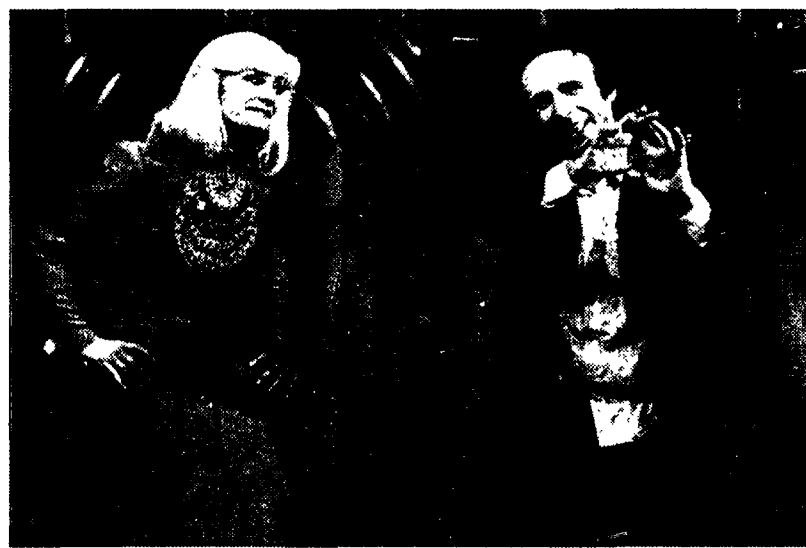
Raffaella Carrà e Roberto Benigni nella serata choc di «Fantastico»

Insieme, i numeri dicono che il varietà non regge più? Vecchia storia. Tanto per aggiornarla, ricorderemo che l'edizione in corso dello show ha stabilizzato il suo ascolto intorno ai 7 milioni e 600 mila spettatori non è colpa sua, ma degli spettatori stessi che il sabato sera guardano in assoluto molto meno la tv.