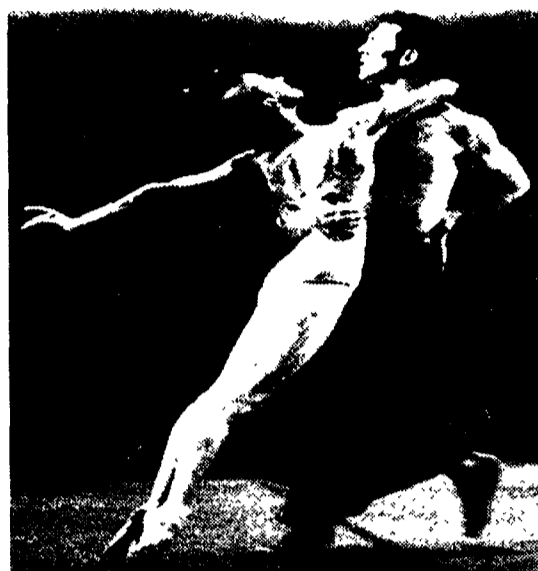
Un'immagine del trittico di danza in scena a Prato

I «collage» di balletti diversi non sono sempre perfetti, ma il trittico del Balletto di Toscana in scena al Metastasio di Prato è un raro esempio di equilibrio.