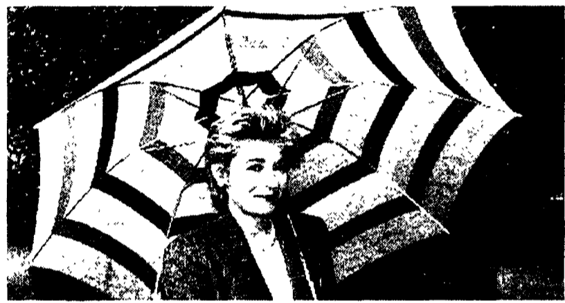
Donatella Raffai torna su Raitre con «Parte civile»

Martedì sera alle 20.30 Donatella Raffai entrerà in scena con il primo «caso». Ogni pun-