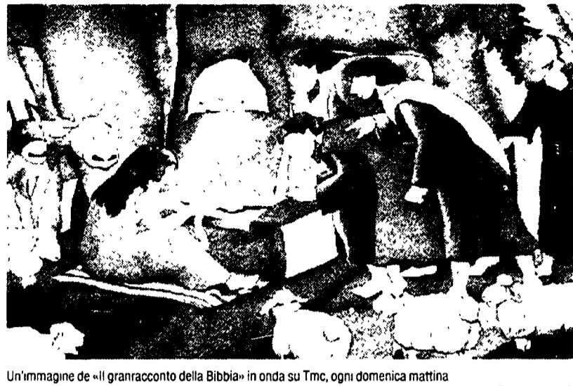
Un'immagine de «Il gran racconto della Bibbia» in onda su Tmc, ogni domenica mattina

Ma il palinsesto di Tmc, dedicato ai cartoon, non si esaurisce con questa versione della Bibbia. A parte i programmi matutini G.I. Joe e Scooby Doo (la domenica alle 9.45 e 10.45), durante la settimana, alle 14.35, in coda a Ottovolante, va in onda Snack che propone ogni giorno una serie animata diversa. Si parte il lunedì con Starcom, il martedì è la volta di Galaxy High School, mentre il mercoledì è dedicato a Galtur, giovedì tocca a Isabelle de Paris ed i venerdì si chiude con la piccola saga fantasy di Una spada per un cavaliere.