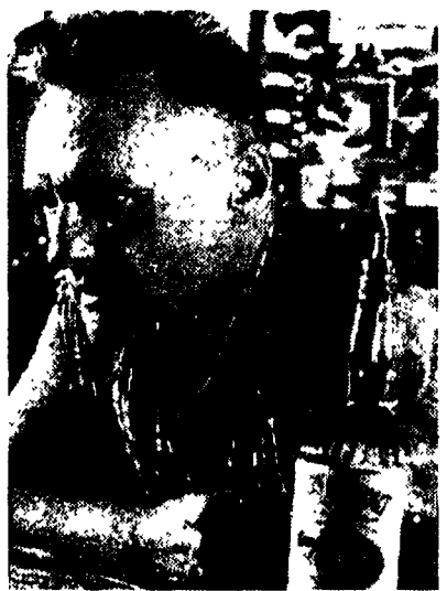
Qui accanto Dennis Hopper in una scena del film di Sean Penn «Lupo solitario»

Lupo solitario Regia e sceneggiatura: Sean Penn. Interpreti: David Morse, Viggo Mortensen, Valeria Golino, Charles Bronson, Dennis Hopper, Sandy Denny.