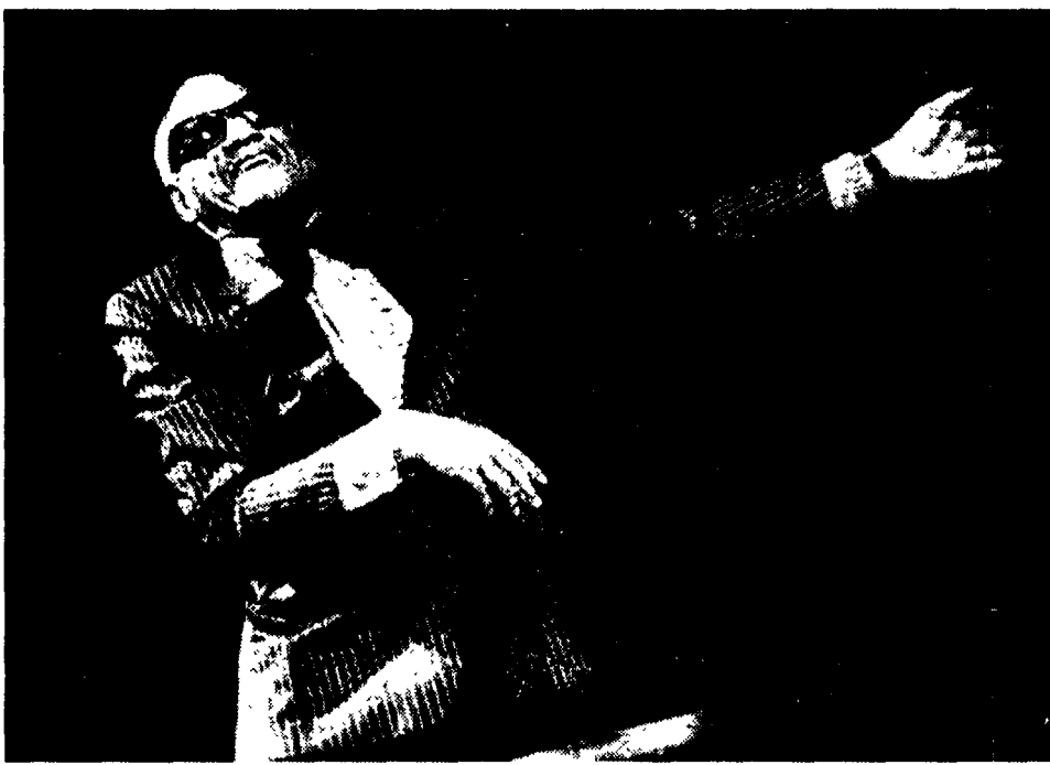
Ray Charles durante il concerto al Teatro Sistina di Roma

Grande successo di Ray Charles a Roma, prima tappa italiana del tour europeo del «poeta del soul». Lo spettacolo dell'artista americano toccherà, nei prossimi giorni, altre dieci città della penisola.