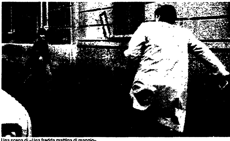
Una scena di «Una fredda mattina di maggio»