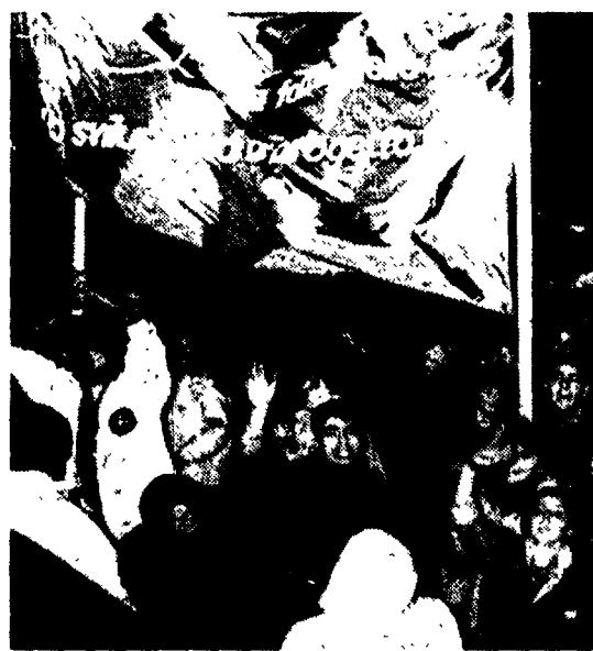
Fiuggi, la festa del dopo-voto