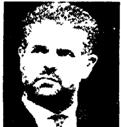
Formigoni: col governissimo, Craxi presidente del Consiglio

«Anche Craxi si è ora convinto che il governissimo non è un'operazione anti-socialista che non è la tradizione rivisitata e corretta del compromesso storico...»