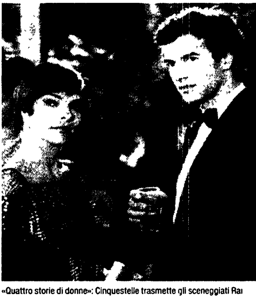
«Quattro storie di donne»: Cinquestelle trasmette gli sceneggiati Rai