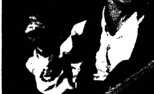
Il concerto di Eros Ramazzotti che Canale 5 trasmette questa sera via satellite, alle 20.40, dal Palau St. Jordi di Barcellona

Canale 5, in diretta (20.40) Eros «live» a Barcellona Per la Fininvest si apre l'era dei grandi eventi pop