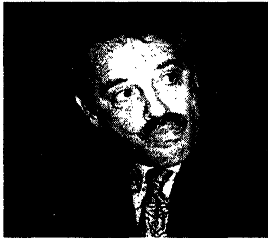
Il direttore di Raidue Giampaolo Sodano

Invitato a riflettere sulla eccessiva omogeneità fra le proposte di Raiuno e Raidue, Sodano risponde: «Mi domando perché Raiuno non cambi. È indiscutibile che la rete abbia passato, e passi tuttora, mo-