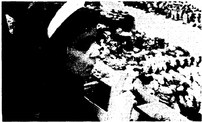
Vetrine a festa e bancarelle a piazza Navona: al via lo shopping natalizio

Al blocco di partenza la corsa agli acquisti natalizi. Molti i passanti che affollano Piazza Navona, circondata dalle tradizionali bancarelle. I romani vanno in cerca di addobbi, ghirlande e statuine del presepio. Ma per i regali il mercato sembra subire un calo. Sono pochi quelli che si decidono a comprare, persino i giocattoli stentano a prendere quota. E per i commercianti è polemica sulla fascia blu.