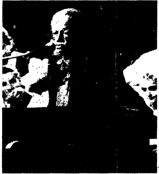
Lunedì prossimo Gino Paoli in concerto su Canale 5

nove emittenti radiofoniche trasmetteranno il concerto in diretta (ore 21), mentre Radio Italia accompagnerà la messa in onda su Canale 5 con lo stesso segnale, consentendo ai telespettatori di seguire lo spettacolo in stereofonia.