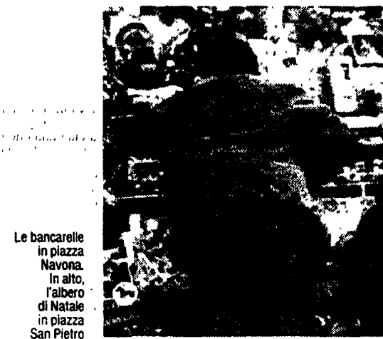
Le bancarelle in piazza Navona. In alto, l'albero di Natale in piazza San Pietro