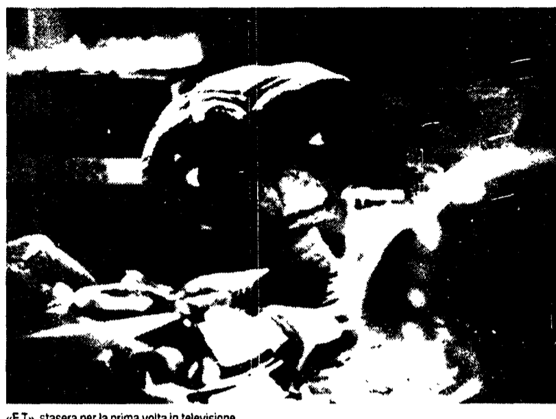
«E.T.», stasera per la prima volta in televisione

La trilogia di Indiana Jones, Spielberg ha sempre vissuto i suoi successi con una punta di imbarazzo, e ha periodicamente tentato di darsi una dignità d'autore con film «adulti» come Il colore viola o L'impero del sole.