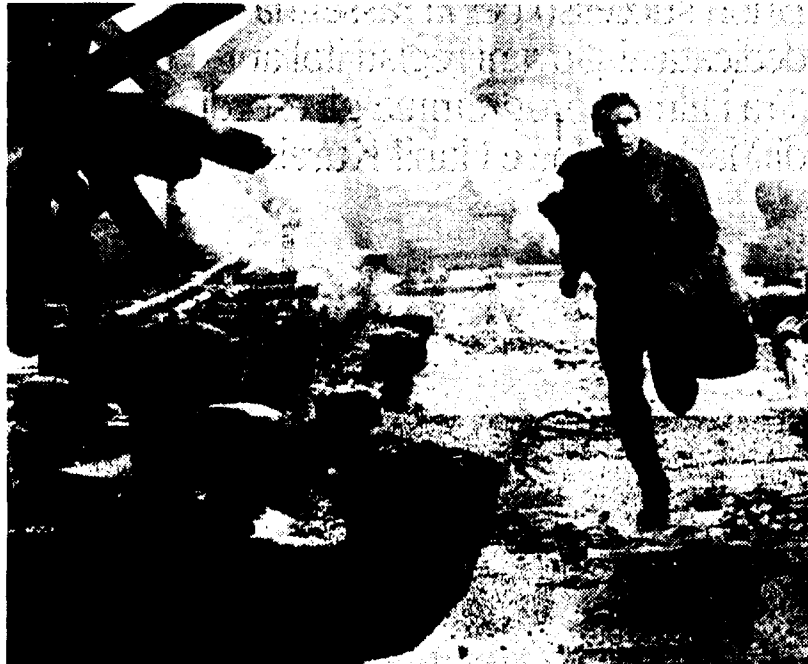
Harrison Ford in una scena del film «Blade Runner», di Ridley Scott