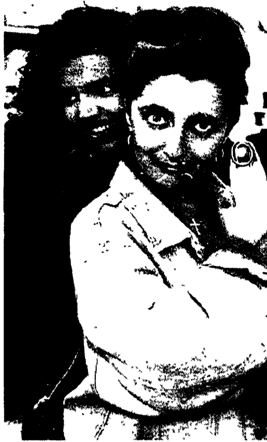
«Avanzi» e il 1992 con le previsioni di Rocco