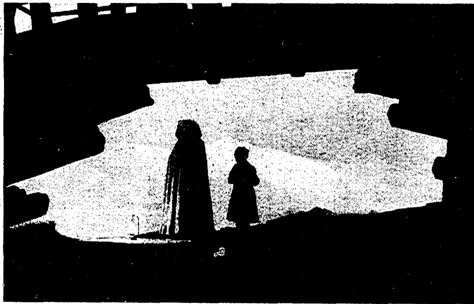
Un'immagine di «Black Narcissus» un film degli «Arcturi» Michael Powell ed Emeric Pressburger

Cinema inglese, fuori i nomi. I primi che vi vengono in mente. Hitchcock? Benissimo, promossi. Ma non dimenticate che ha lavorato soprattutto in America.