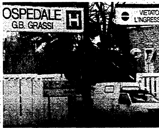
L'ospedale Grassi di Ostia