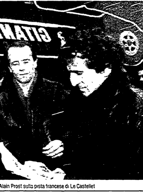
Alain Prost sulla pista francese di Le Castellet