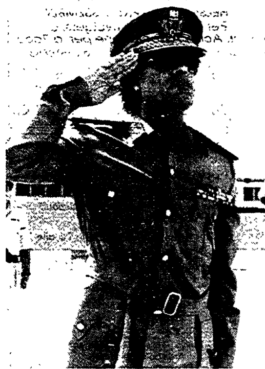
Il colonnello Muammar Ghaddafi

CITTÀ DEL VATICANO Per tutta la giornata di ieri, ventitré Nunzi apostolici delle capitali europee, riuniti sotto la presidenza del Segretario di Stato cardinale Angelo Sodano, hanno messo a confronto informazioni e valutazioni per favorire la ridefinizione della strategia della S. Sede di fronte alle situazioni nuove e ai grandi mutamenti che vi sono stati in Europa dopo la fine dell'Unione Sovietica.