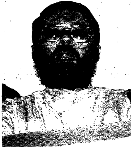
Abdelkader Hachani, segretario del Fronte Islamico algerino

Giro di vite contro i fondamentalisti musulmani ad Algeri. Il capo del Fronte islamico di salvezza, Abdelkader Hachani, è stato arrestato ieri sera in un quartiere popolare della capitale algerina.