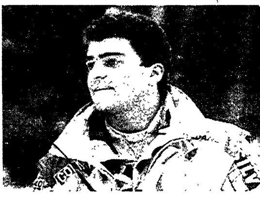
Alberto Tomba cerca il suo primo successo sulla pista di Wengen

che ci sia spazio per la discesa nel mio futuro. Nel '94-95, ultima stagione della mia carriera, può anche darsi che mi dedichi totalmente alla discesa.