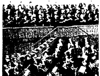
L'orchestra sinfonica della Rai di Milano