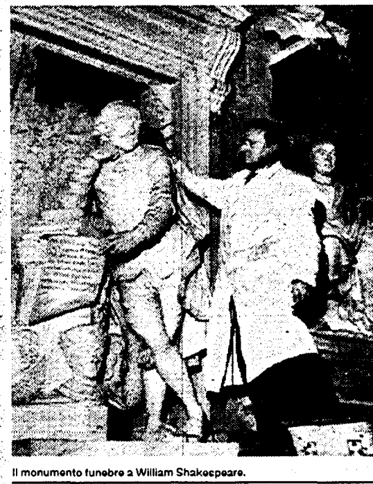
Il monumento funebre a William Shakespeare.