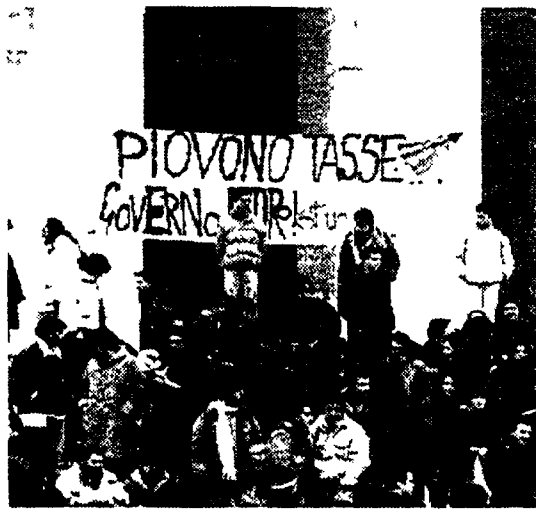
Una manifestazione alla Sapienza contro il carotasse