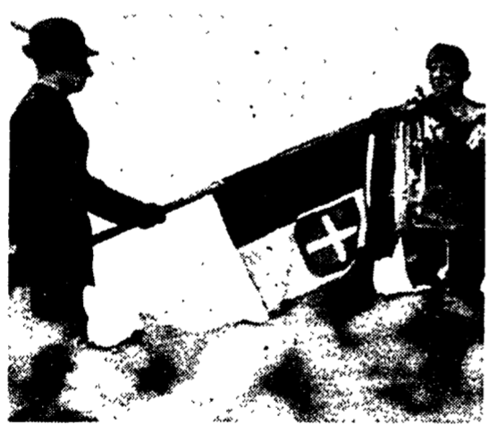
Vittorio Emanuele III consegna la medaglia d'oro ad un reggimento alpino nel 1942