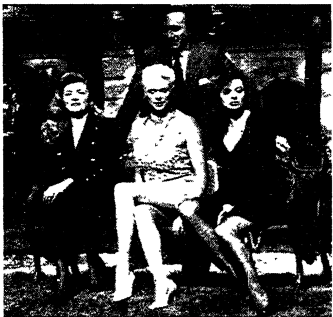
Pippo Baudo con le tre presentatrici che lo affiancheranno a Sanremo: da sinistra, Milly Carlucci, Brigitte Nielsen e Alba Parietti, sotto Adriano Aragozzini

Neppure la presunta e sbandierata «selvaggia» di Alba Parietti potrà cambiare le carte di una manifestazione che quest'anno anche più dei precedenti è nelle mani di magistrato, polizia e carabinieri. I giudici lavorano da tempo su Aragozzini, mentre le forze dell'ordine fanno sapere che non è lui il «mostro».