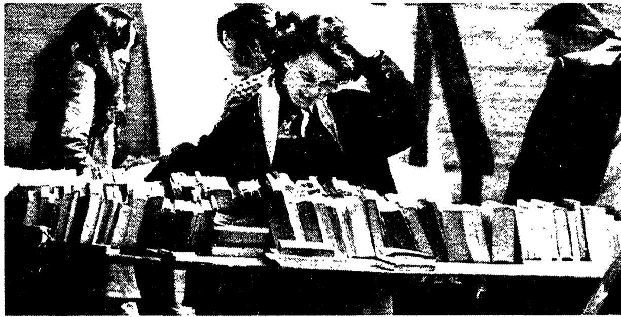
Mercatino di libri usati tra i viali della città universitaria. In basso, studenti curvi sui libri in un'affollata biblioteca della Sapienza.

Posti scarsi per gli studenti e per i testi nei 143 locali a disposizione. La distribuzione funziona solo per poche ore. Personale «bloccato» aggiornamento a ritmi lenti