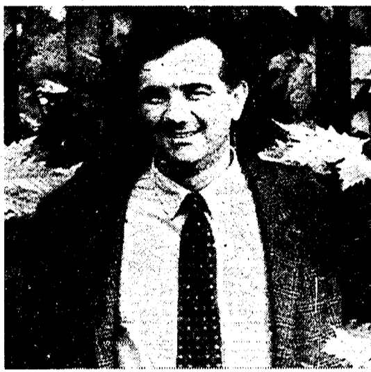
Gene Gnocchi: tv, libri o teatro è sempre un successo

Grande richiesta per lo show di Gene Gnocchi al Ciak di Milano. Successo di pubblico e tiepida critica per il debutto di questo comico del tutto nuovo, passato dalla tv alla scrittura, al palcoscenico. Il suo libro, Una lieve imprecisione, è ben piazzato nelle classifiche di vendita, anche se non concede niente all'effetto ridanciano. E presto un nuovo impegno televisivo. Ma lui dice: «Non sono un professionista».