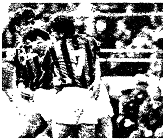
I rossoneri festeggiano Van Basten. In alto il terzo gol del centravanti olandese giunto a quota venti nella classifica dei cannonieri