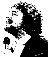
Beppe Grillo querelato da un generale della Finanza