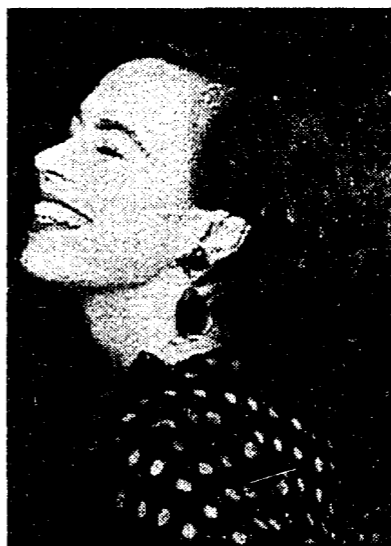
Qui accanto Vanessa Redgrave. Sopra Rickie Lee Jones e in alto Sarah Jane Morris, tre protagoniste di «Swing Ladies».