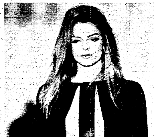
Un modello di Miia Shou sfilato a Milano

MILANO. La cosce si-vede-u-non-si-vede, dallo spacco inguinale della sottana lunga. La cavaglia è nascosta dallo stivale stringato inizio secolo. Il seno è coperto da giacche maschili, camicie e cravatte. E se i cappotti fanno il verso alle divise di ordinanza, gli abiti da sera con orli ai piedi evocano quelli funerei di Morticia Addams, anziché i modelli color-lacca di Lanterne Rosse. È decisamente austera la moda femminile autunno-inverno 92/93, in passerella a Milano da sabato scorso, nei palcoscenici fieristici di milanocollezioni. Le sfilate delle grandi firme, oltre una cinquantina, proseguiranno, accompagnate da feste e mondanià, sino a domani. Ma è già evidente che, dopo stagioni di trasparenze, giulietti, seni al vento e mutande in mostra, coi prossimi freddi la donna tornerà a coprirsi, in senso lato e reale, con abiti che ricordano i tardi anni 20 e la Repubblica di Weimar. La rigorosa controtendenza è sottoscritta persino da Dolce e Gabbana: inventori dello scollacciato look Madonna che, non a caso, stanno vestendo la star americana, sul set di Body of Evidence, gli abiti sado-maso. Eliminate guerpriere e reggicollie, i due stilisti, hanno mandato in passerella cappotti di cammello lunghi sino ai piedi e tailleur a