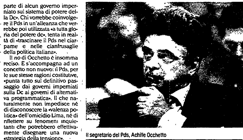
Il segretario del Pds, Achille Occhetto

ROMA. Il piano destabilizzante è già diventato una «paccata» (parola di Andreotti), ma anche grazie a quel «piano» i partiti provano a disegnarne gli scenari futuri, a ipotizzare gli sbocchi del dopo-elezioni.