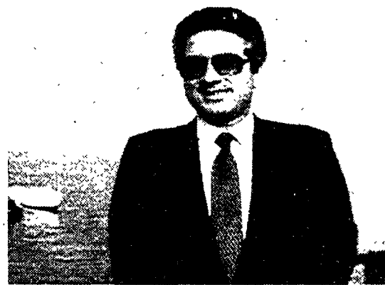
Il presidente della Federcalcio Antonio Matarrese