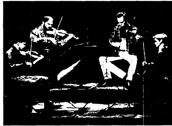
Il Kronos Quartet durante il concerto all'Olimpico di Roma