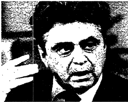
Il segretario del Pds Achille Occhetto

«Non può essere la Dc lo scudo contro la disgregazione del Paese. Proprio dal suo sistema di potere nasce la crisi e la malattia italiana».