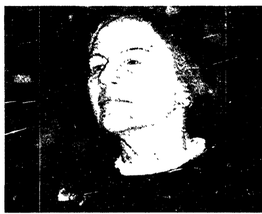
Il presidente della Camera Nilde Iotti