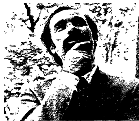
Antonio Ricci autore di «Striscialanotizia»

Striscialanotizia come Samarca. Anche il tg satirico di Canale 5 sarà «oscurato» dal 30 marzo al 4 aprile.