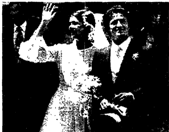
Carolina di Monaco il giorno del suo matrimonio con Philippe Jounot

Si avvia ad essere annullato dalla Sacra Rota il matrimonio di Carolina di Monaco con Philippe Jounot. La vedova di Stefano Casiraghi, se la prima sentenza di cui si è avuta notizia ieri sarà confermata, potrà liberamente risposarsi in chiesa. Probabilmente con Vincent Lindon, il giovane attore francese che in questi mesi, stando alle cronache, le è stato affettuosamente (e discretamente) vicino.