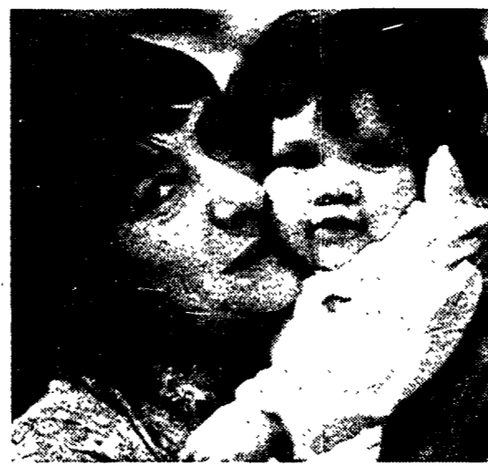
Un'immagine di «Adoption» di Márta Mészáros