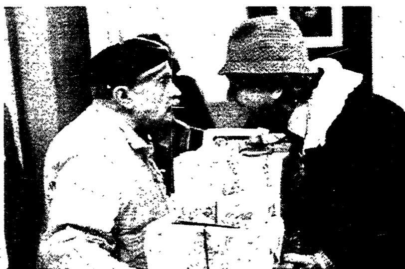
Paolo Panelli in «Parenti serpenti»: il nuovo film di Mario Monicelli