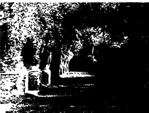
I Grandi Magazzini Severniani nel parco archeologico di Traiano

«Quale errore? Tutti questi crediti all'edilizia al terziario al settore finanziario sono dovuti a un errore "telescopico" delle banche.