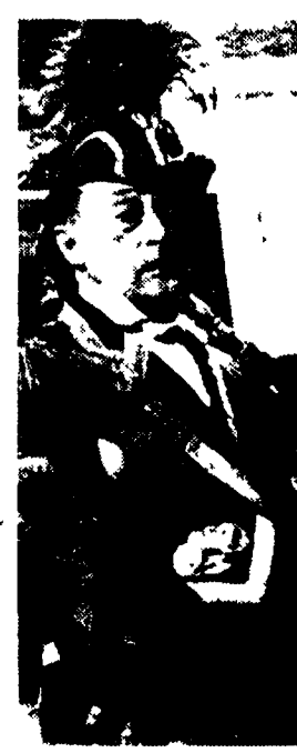
Totò, il più gettonato sulle tv locali

Presentata a Milano l'indagine Datamedia sugli ascolti delle emittenti locali. Censite 719 televisioni alle quali guardano quotidianamente 35 milioni di telespettatori per una media di 13 minuti al giorno.