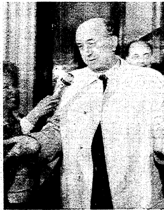
Il presidente della Democrazia cristiana Ciriaco De Mita

me di chi la gestisce. Sul portone di piazza del Gesù, De Mita è meno critico ma sempre sintetico: «Gli spazi bisogna ancora trovarli. Si sta riflettendo». Ma la riflessione a cui poi si abbandona di fronte allo stato maggiore della sinistra dc è forse ancora più drastica di quella di Gava. Lascia, il presidente dc, che sia Goria a prendere per primo la parola e spiegare che «il rinnovamento è esigenza indifferibile». Poi replica secco: «Prioritario è l'accertamento dei contenuti del processo nuovo da avviare, altrimenti - che rinnovamento?». Altrettanto risoluto è, De Mita, sulla strada da percorrere: «Il quadripartito è finito. Può anche reggere numericamente, ma politicamente non c'è più. C'è, invece, un lavoro costitutivo da compiere, a cui tutte le forze politiche costituzionali - debbono concorrere con pari dignità e liberamente in Parlamento. E siccome non ci sono altre formule di governo, occorre verificare se le stesse forze politiche riescono a esprimere anche un governo costituente, che non abbia altra connotazione se non quella di consentire la transizione. Poi ognuno prenderà la sua strada». Su questa base la sinistra ritrova una posizione concorde. Leopoldo Elia la spiega