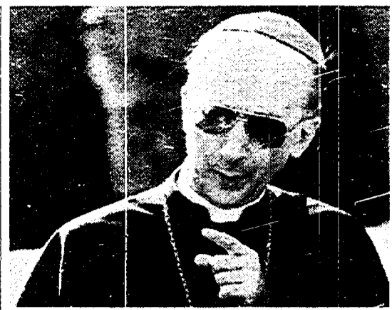
Monsignor Camillo Ruini

Il problema del segretario dc, al dunque, è proprio quello della rilegittimazione. Quella ottenuta dall'Ufficio politico si presta facilmente, oligarchica com'è, alla contestazione. E in effetti, i contestatori non hanno perso tempo: da Clemente Mastella a Francesco D'Onofrio. Ma Forlani proprio di queste scorbante trasversali può approfittare per pretendere un mandato rinnovato di fronte alle incognite delle trattative per la formazione del nuovo quadro politico.