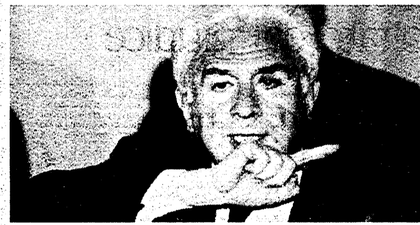
Il presidente Francesco Cossiga

Prima di partire da New York Cossiga non dice no a un eventuale accordo tra Craxi e Occhetto. E aggiunge che l'alternanza darebbe una «garanzia di moralità». All'osservazione che è questa la proposta del Pds, risponde: «Non è detto che Occhetto dica sempre cose sbagliate». Poi insiste sull'ipotesi di sue dimissioni. «Se non fanno il governo, me ne vado e li metto davanti al fatto compiuto».